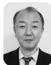
北海道大学電子科学研究所 教授