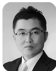
東京大学工学系研究科 教授