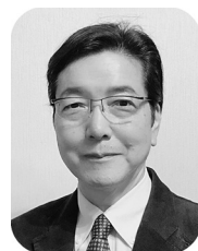
東京大学工学系研究科 教授