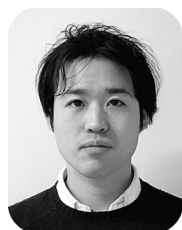
東京大学工学系研究科 特任研究員

「(Li, La)TiO 3 対応傾角粒界における局所イオン伝導測定および原子構造解析」