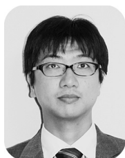
東京大学工学系研究科 特任准教授