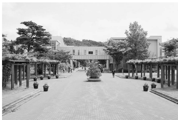
手形キャンパスを正門から臨む.